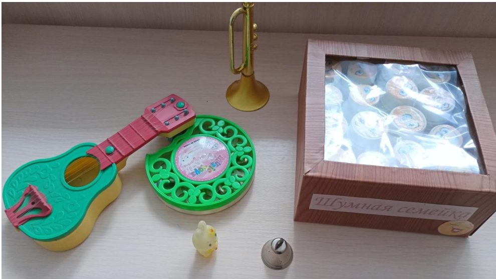
Работа над ритмом.